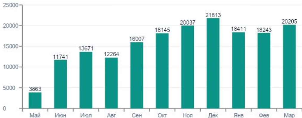
Чистая прибыль (Net, после SF 30%)